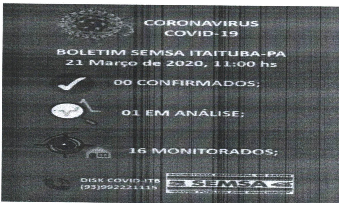
Figura 1: DADOS INICIAIS

De acordo com as informa es divulgadas nos  ltimos dias, atrav s de Boletins Epidemiol gicos oficiais emitidos pela Secretaria Municipal de Sa de, a taxa de infectados por Coronav rus s  aumenta, mostrando o descontrole da dissemina o do v rus no munic pio, havendo transmiss o comunit ria local, o que torna uma preocupa o para gest o municipal e justifica a compra de cilindros de oxig nio medicinal e kit regulador com flux metro, em virtude do aumento no n mero de sequelados do COVID-19 que necessitam de suporte para seu tratamento.